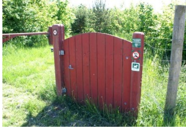
Vækst: Indgang til Tusindårsskoven....